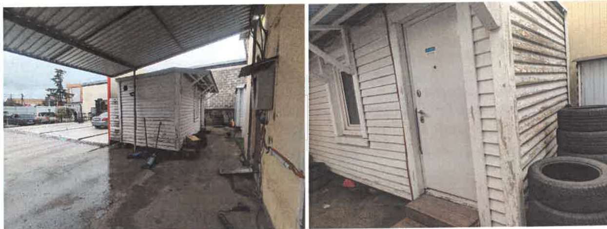
Объект № 3