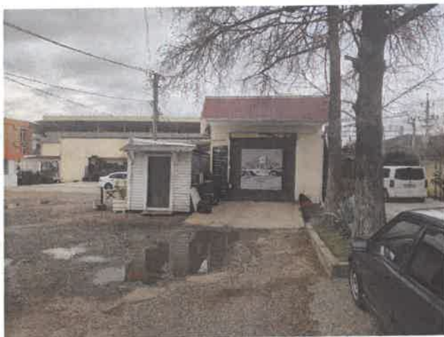
Объект № 1